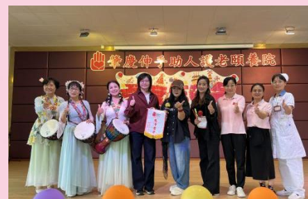
广东肇慶敬舞舞團分中心