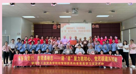
肇慶市工業貿易學校