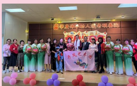
高要區丹鳳藝術團