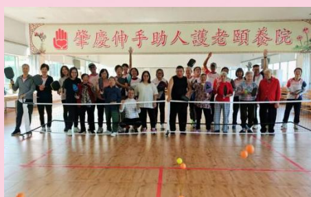
肇慶綠地樾湖匹克球隊