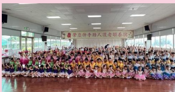
金利鎮樂貝爾幼稚園