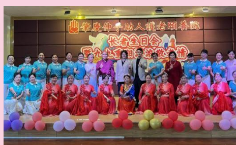
肇慶市老幹活動中心